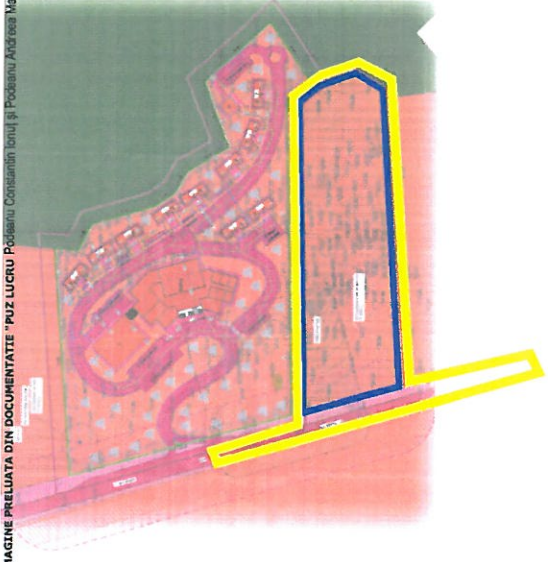
IMAGINE PRELIIATA DIN DOCUMENTATIE "PUZ LUCRU Proiectul Consiliului Local al Podbeanu Anularea Maria"